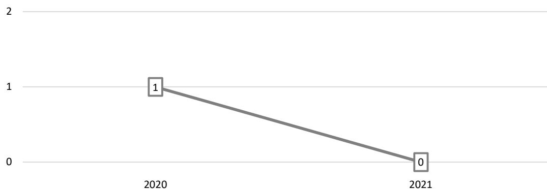
Diagram 10.1.1.a Data Perempuan Dewasa Kabupaten mengalami Kekerasan Fisik dan Psikologis oleh Selain Orang Terdekat di Kabupaten Tapin Tahun 2020-2021.