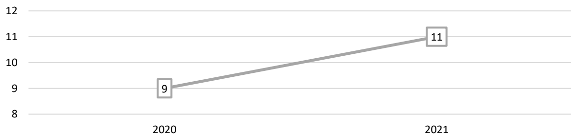
Diagram 10.1.2.a Data Anak Berbadan Hukum (ABH) di Kabupaten Tapin Tahun 2020-2021.