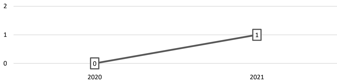
Diagram 10.1.2.b Data Anak Bermasalah Perilaku Salah Pola Asuh di Kabupaten Tapin Tahun 2020-2021.