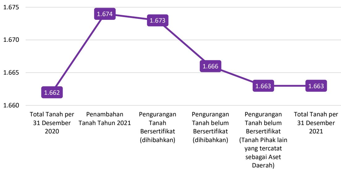
Diagram Data Total dari Penambahan dan Pengurangan Tanah (Persil) di Kabupaten Tapin Tahun 2021.