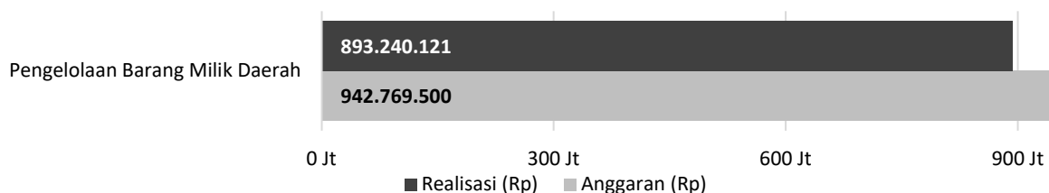
Diagram 26.1.3.b Perbandingan Realisasi dan Anggaran Program Pengelolaan Barang Milik Daerah Kabupaten Tapin Tahun 2022.